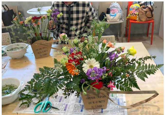
※J.COM 様からの取材の様子